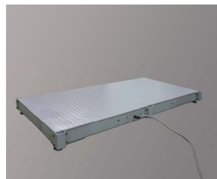
Рисунок 1 – Внешний вид весов модификаций ВПП и ВПВ.